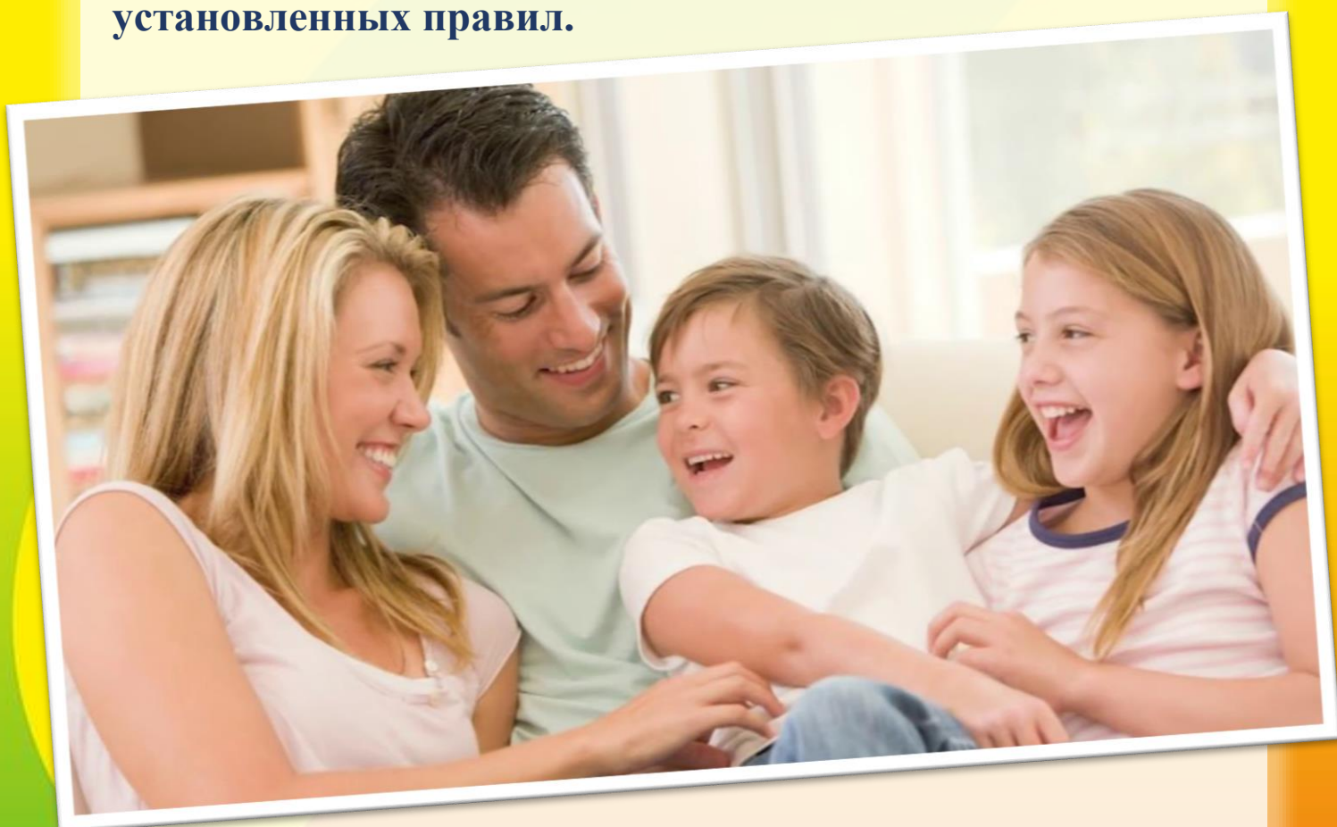
Фото использовано в качестве иллюстрации.

P.S. Надеюсь, что ознакомившись с этими причинами плохого поведения детей, вы впредь не будете допускать ошибок в воспитании своих малышей. Ребенка нужно и можно наказывать в одной ситуации – за нарушение установленных правил.